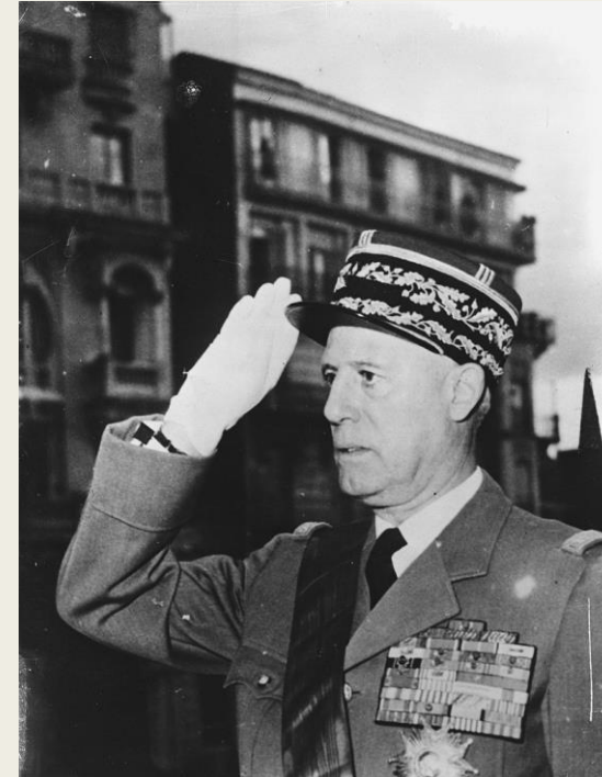
Le général Raoul Salan

https://commons.wikimedia.org/w/index.php?curid=65260609