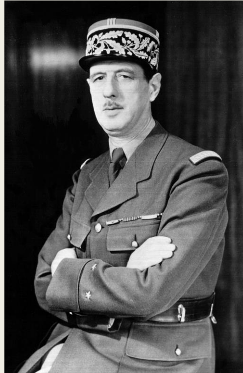
Le général de Gaulle

https://commons.wikimedia.org/w/index.php?curid=107273333