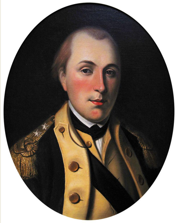
Le marquis de Lafayette